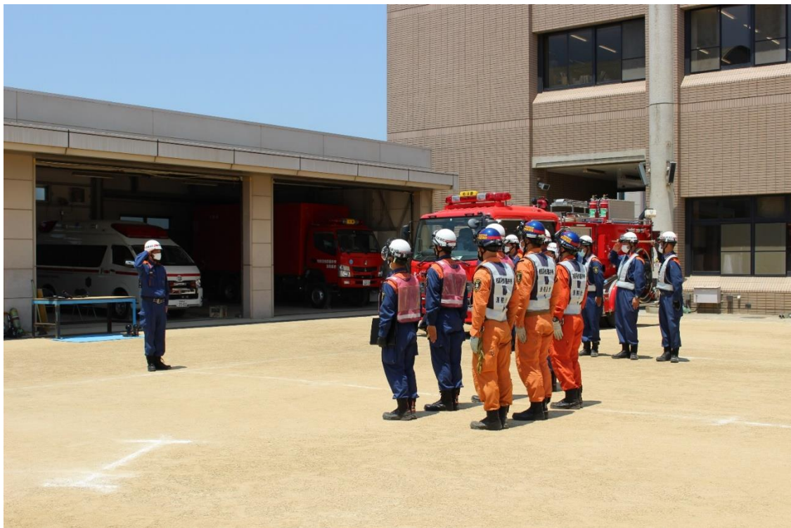
職員効果測定記録会 終了