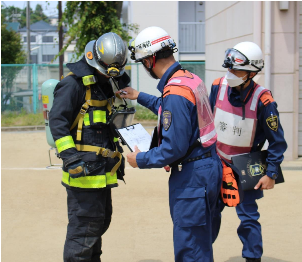
防火装備着装・空気呼吸器着装の審査