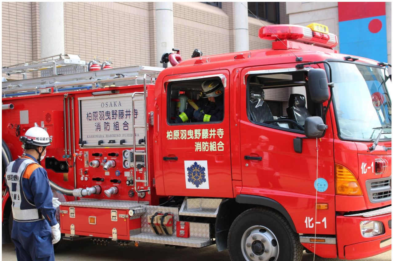
空気呼吸器を装着