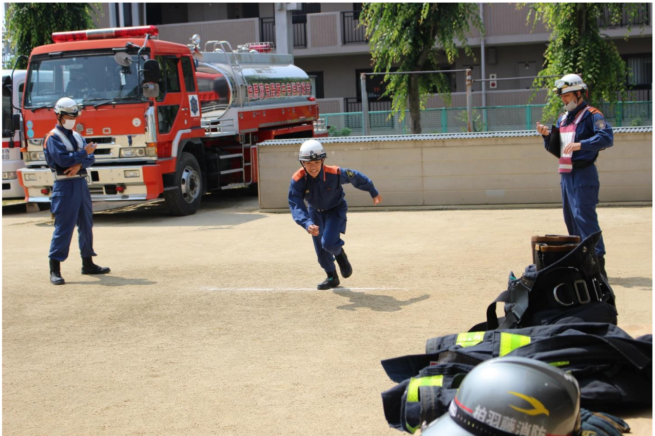
測定開始（スタート）

的確な確認呼称と真剣な眼差しで取り組む姿勢は、災害現場さながらの緊張感があり、大変有意義な記録会となりました